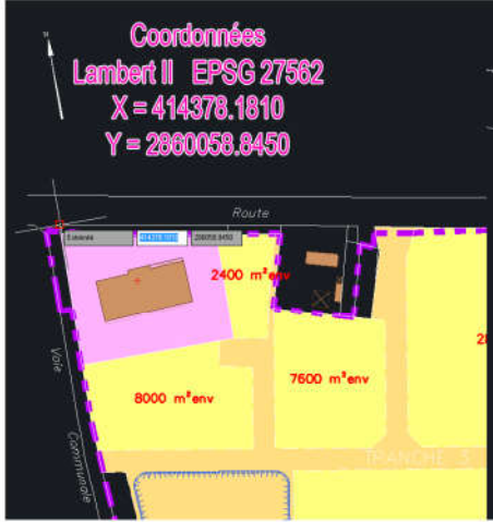
Plan historique sous Lambert II